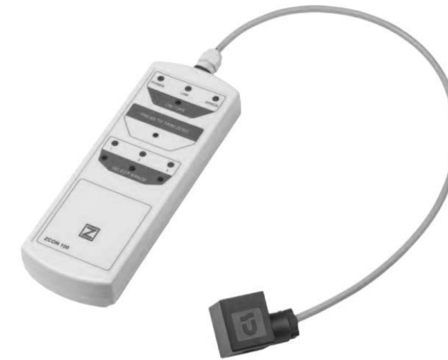
Рисунок А.1 – Внешний вид конфигуратора