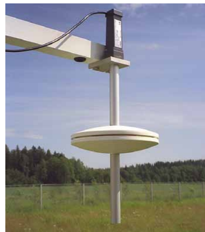
Барометр PTB210 с головкой статического давления SPH10.

Цифровой барометр Vaisala BAROCAP® PTB210 это надежный прибор для наружной установки, выдерживающий исключительно суровые условия окружающей среды.